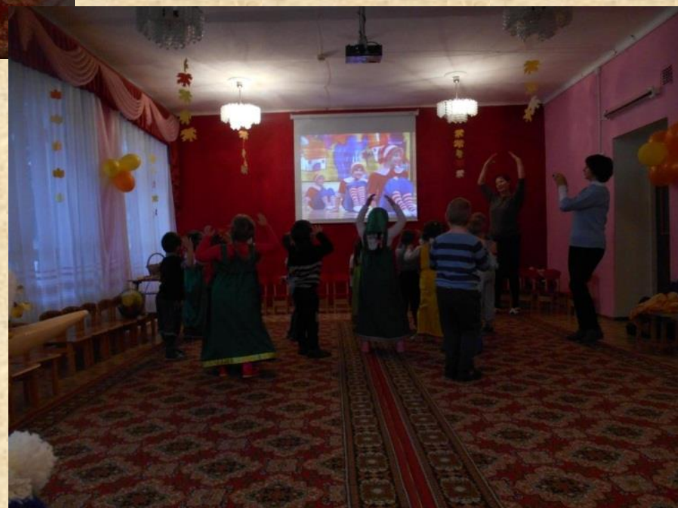
Общий танец «Буратино».