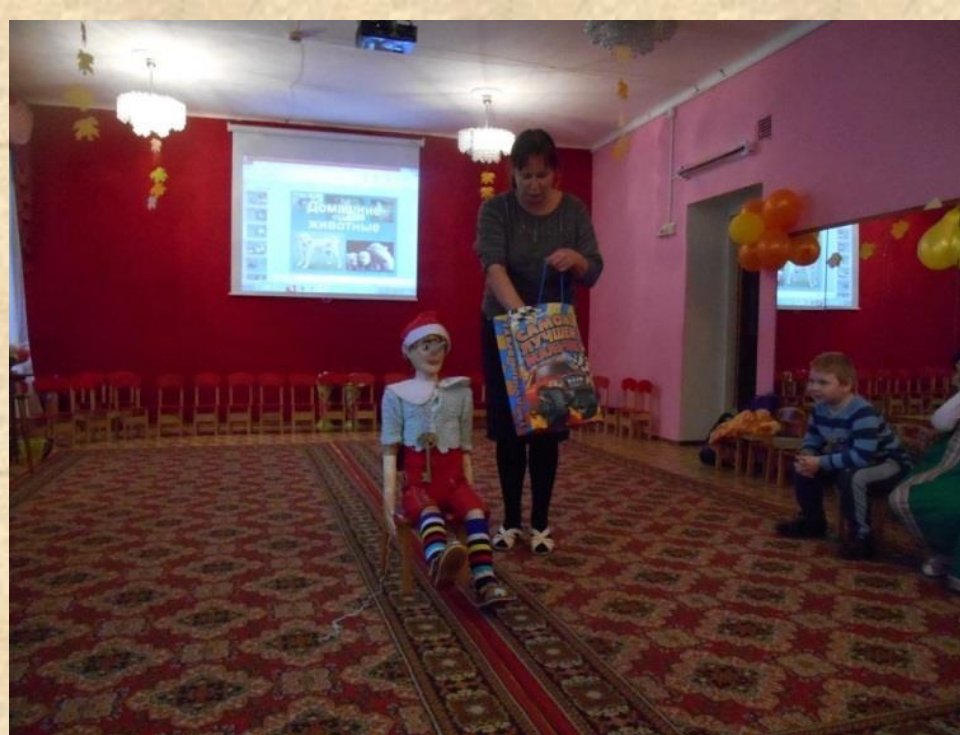
Подарок для Буратино

Рассказываем Буратино стихи о животных, которые дают шерсть. •