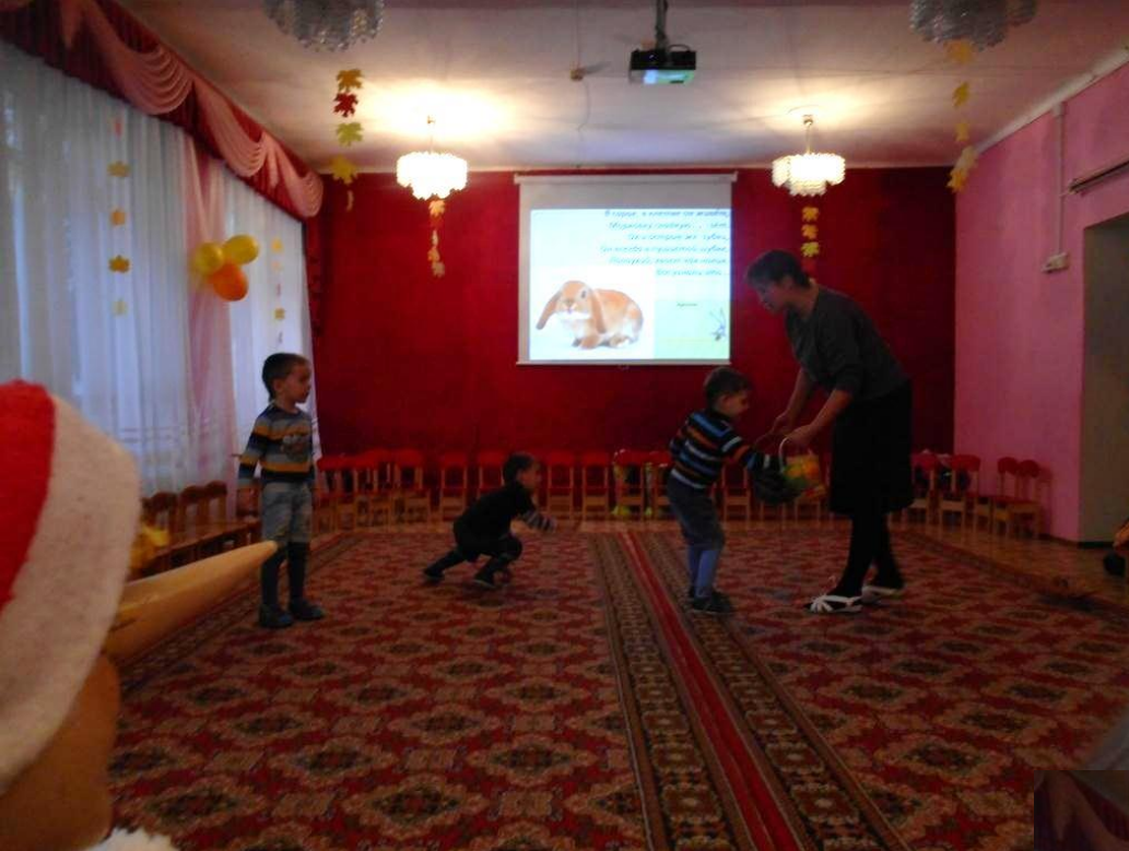
Игра «Собери цветные клубочки».